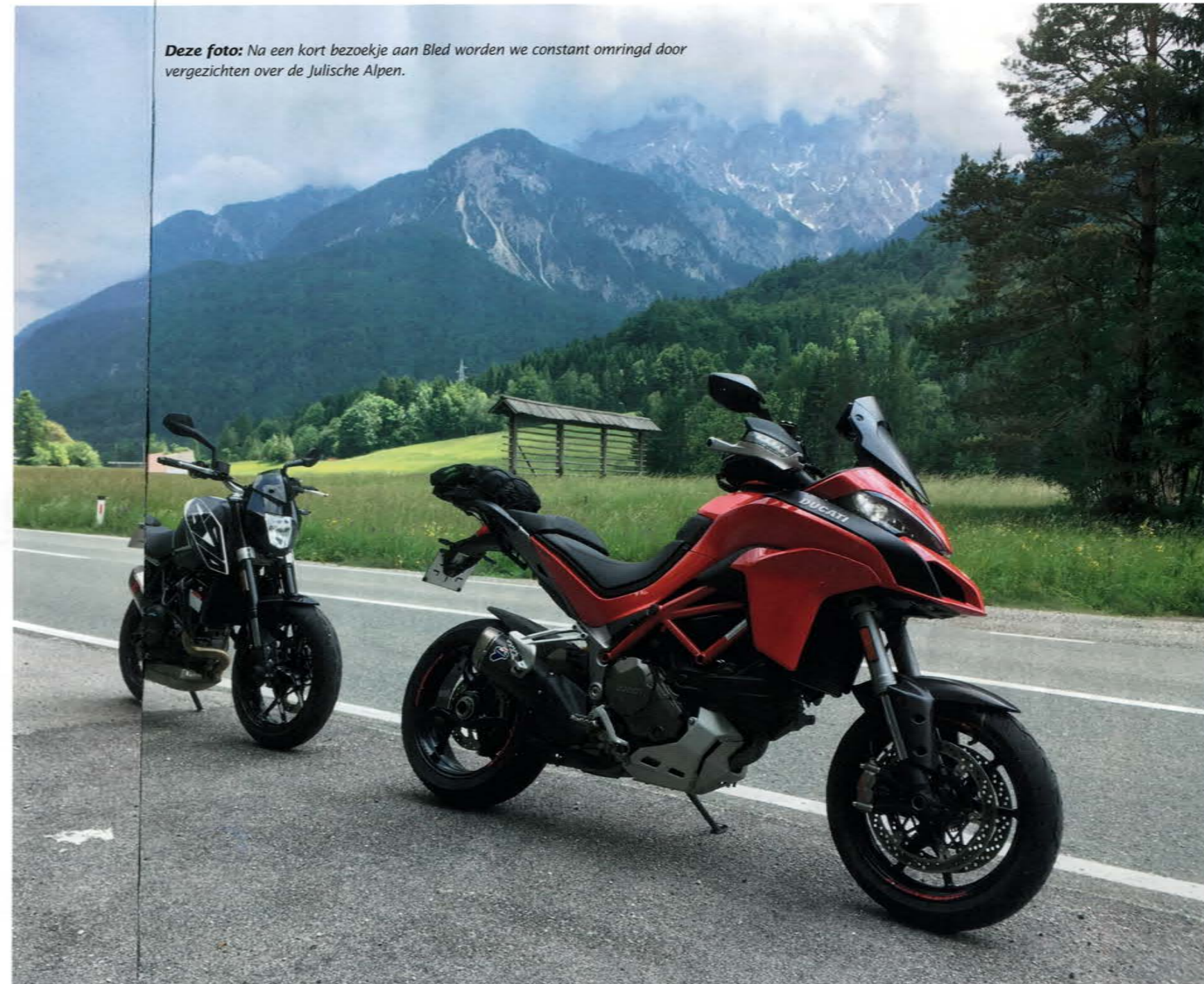
Deze foto: Na een kort bezoekje aan Bled worden we constant omringd door vergezichten over de Julische Alpen.

Voor de volgende dag hebben we een rit van 220 kilometer uitgestippeld langs de kustweg tussen Kostrena en Zadar. De E65 bestaat voor 90 procent uit ronduit perfecte wegen en leidt ons van baaitje naar baaitje, het ene al pittoresker dan het andere. En ondertussen doorkruisen we 'en passant' ook nog enkele prachtige natuurparken langs uitdagende slingerbochten. Deze E65 is blijkbaar een gekende plezierweg voor tal van motorliefhebbers die graag hun kneesliders eens willen opschuren. Van motor-